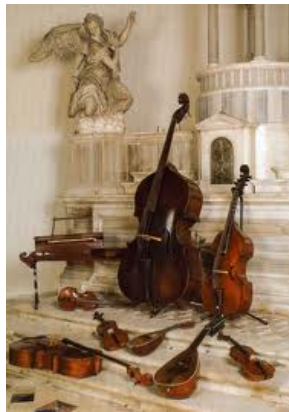
Intrumentos barrocos.

Del mayor interés fue la visita a nuestro país del conjunto italiano “ Interpreti Veneziani ”, que se presentó en la “ Temporada Internacional de Conciertos Fernando Rosas ” de la Fundación Beethoven .