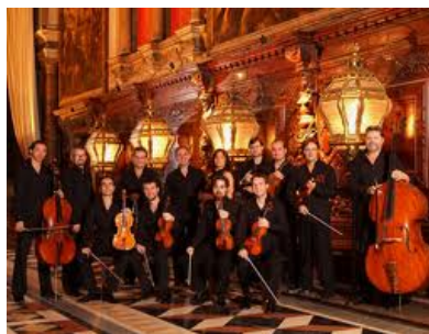
Interpreti Veneziani.

En líneas generales, destacan muy bien los diálogos, frasean en forma inteligente, apoyándose en interesantes articulaciones, que otorgan vitalidad a las versiones, utilizando un sonido pastoso y cálido, opuesto al brillante, por el que optan otros conjuntos.